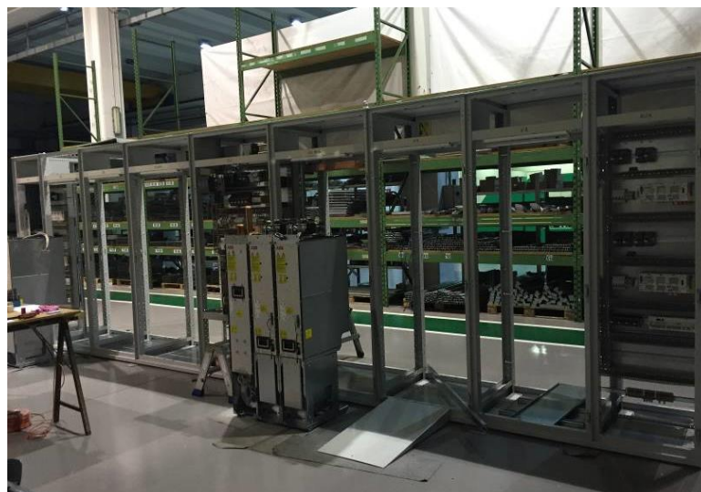
Quadro Inverter in costruzione presso la sede AIC di Torbole Casaglia

Tutta la fornitura è composta di soluzioni e componenti standard, perché uno degli obiettivi di AIC è la salvaguardia dell'investimento e della libertà di scelta del cliente nel tempo, ottenuta evitando l'utilizzo di sistemi dedicati.